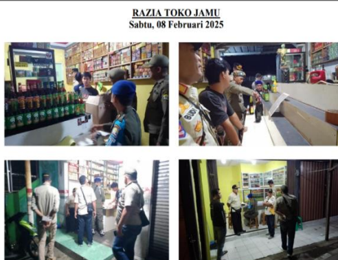
Gambar 2 Razia Operasi Penyakit Masyarakat Minuman Keras di daerah Benggala dan Kasemen Kota Serang