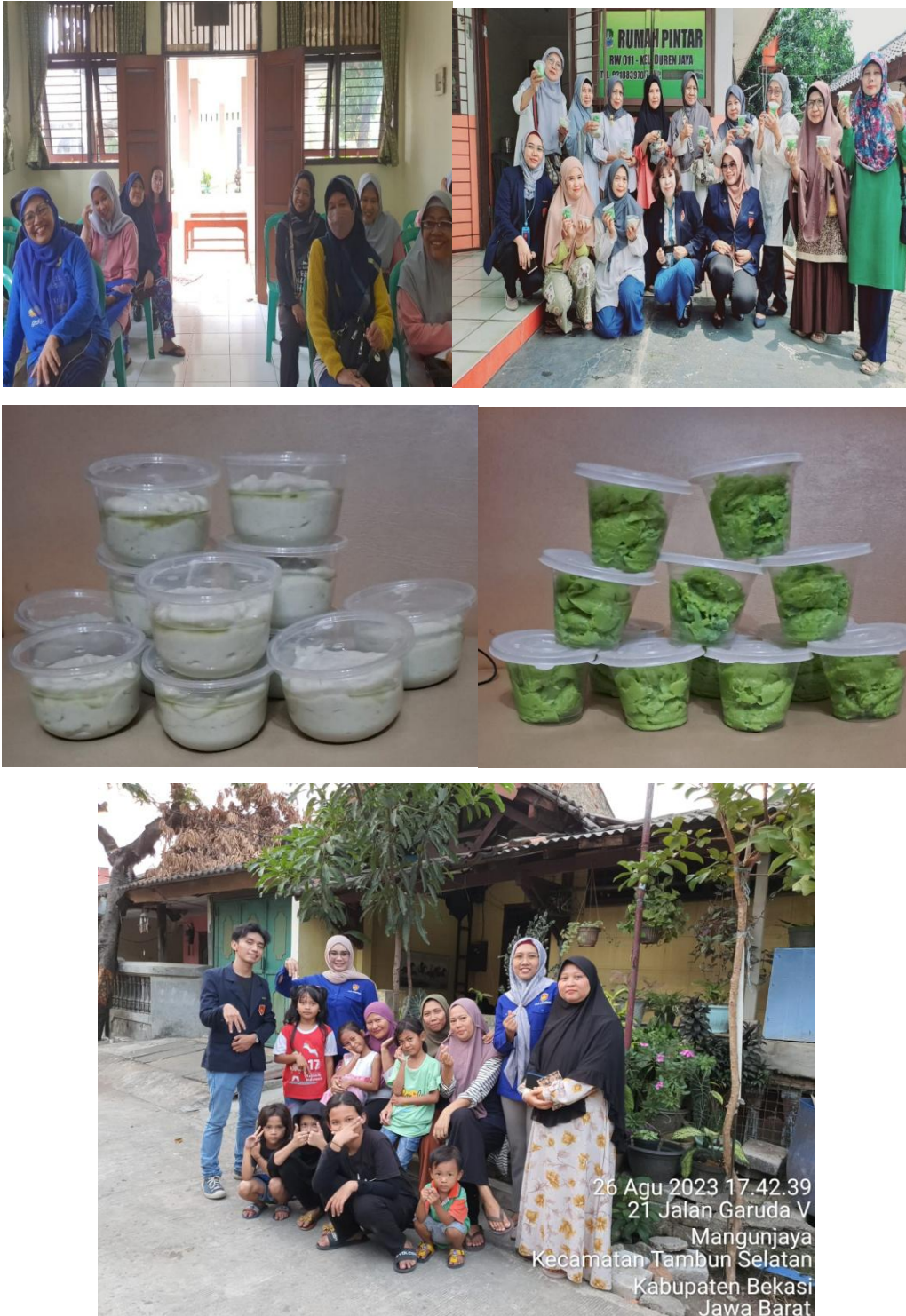
Gambar 1. Produk dari Pengabdian Masyarakat Tim Pengabdian Masyarakat dan Peserta Pengabdian